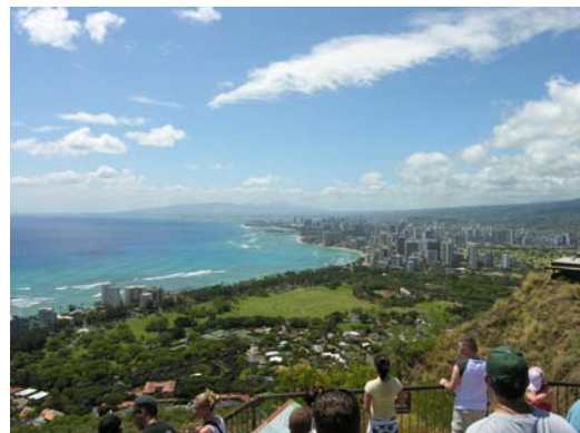
Vom Diamond Head