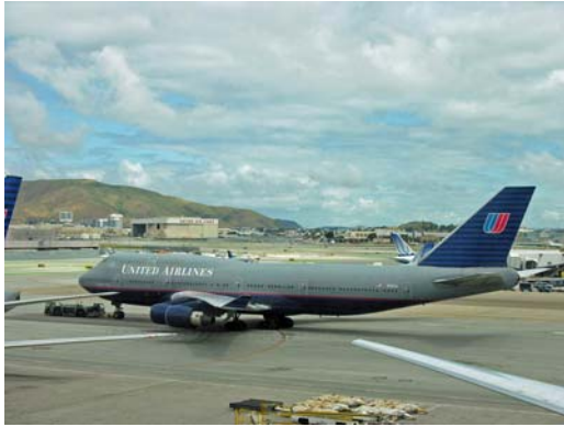
SFO Intl. Airport

In San Francisco haben wir ca. 7 Stunden Aufenthalt. Es ist durchaus möglich, mit dem BART (Bay Area Rapid Train) in die City zu fahren. Der Flughafen ist andererseits so groß und gut mit Geschäften und Restaurants, Ruheräumen und Toiletten ausgestattet, dass die Wartezeit nicht lang und unbequem werden muss. Am frühen Nachmittag startet dann die Maschine der United Airlines (Boeing 747) zum Direktflug zurück nach Frankfurt a. M.. Die Flugzeit beträgt 11 Stunden plus 9 Stunden Zeitverschiebung.