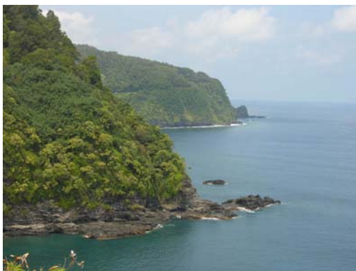
Road to Hana

Die „Road to Hana“ ist eine berühmte kurvenreiche Straße entlang der Nordküste Mauis bis zur östlichsten Spitze. Durch dichten Regenwald, entlang steiler Küstenberge und an verschwiegenen Buchten vorbei, aber immer in Sichtweite des türkisblauen Pazifiks geht unsere Exkursion (Erlebnis-Paket, ca. 11,5 Stunden) nach Hana, einem sehr malerischen Künstlerort. Besonders attraktiv ist in der Hana Bay das Schnorcheln. An Wasserfällen und Taro-Feldern vorbei geht es dann weiter zur Südküste, wo das Grab von Charles Lindbergh zu finden ist, bis wieder die trockene Sonnenregion in Kihe'i erreicht ist. Damit ist zugleich das Haleakala-Massiv einmal umrundet, das uns morgen auf seinen Gipfel ruft. Diese Tour kann unter anderem durch die