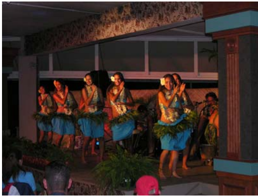
Lu'au mit Hula

Morgens startet am Hotel der Bus für die Große Inselrundfahrt (Erlebnis-Paket, ca. 5 Stunden), die auch in das malerische Hanalei-Valley und zu den imposanten Wailua-Wasserfällen führt. Es ist immer wieder überraschend zu sehen, welche unterschiedlichen Landschaftsformen und Aussichten die doch relativ kleinen Vulkaninseln der „Hawaiian Islands“ bieten können. Am frühen Abend, um 5 pm, wartet im Aloha Beach Resort ein Höhepunkt auf uns: die Teilnahme an einem „Lu'au“, einem großen hawaiischen Festmahl (Erlebnis-Paket, ca. 4 Stunden). Dazu wird ein ganzes Schwein vorher in einem Erdofen („Imu“) gebacken; es bleibt dabei besonders saftig und wohlschmeckend. Vom Buffet gibt es viele Gemüsesorten und natürlich hawaiische Früchte: Ananas, Mango, Papaya und Makadamia-Nüsse. Man kann auch