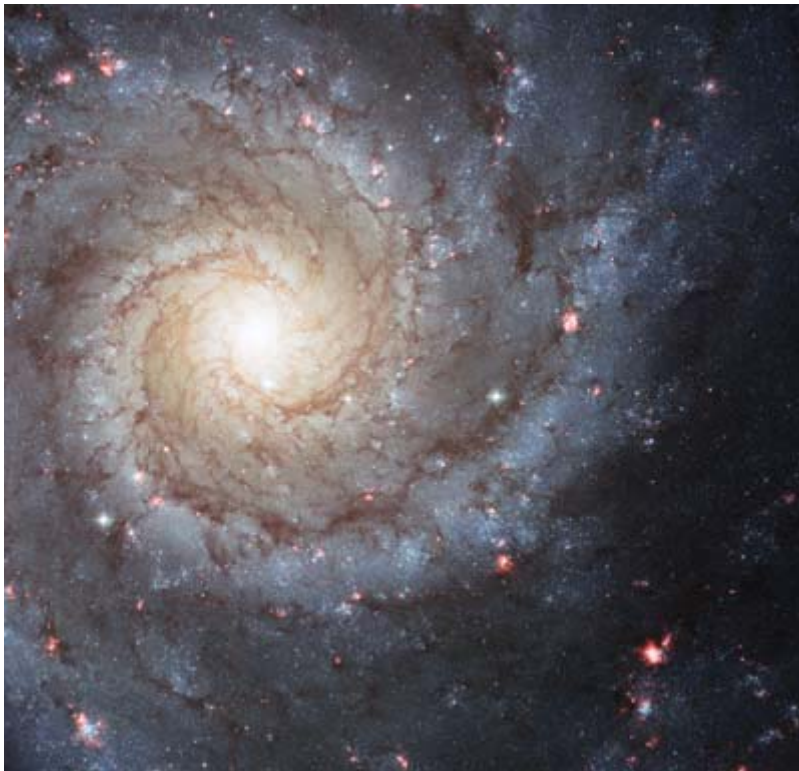
Spiralgalaxie M74

II. Der Blick ins Universum, den uns die modernen, technischen äußerst aufwendigen Teleskope ermöglichen, eröffnet uns Erkenntnisse neuer Welten, unvorstellbar fern in Raum und Zeit. Gleichzeitig wird unsere „Welt“, die Erde als dritter Planet im Sonnensystem, als winziges Teil dieses in ständiger Bewegung und Entwicklung befindlichen Kosmos aus Energie und Materie sichtbar. Der Blick in ferne Galaxien ist zugleich ein Blick in die Vergangenheit, eine Ansicht der Herkunft und vielleicht auch der Zukunft unserer planetaren Welt.