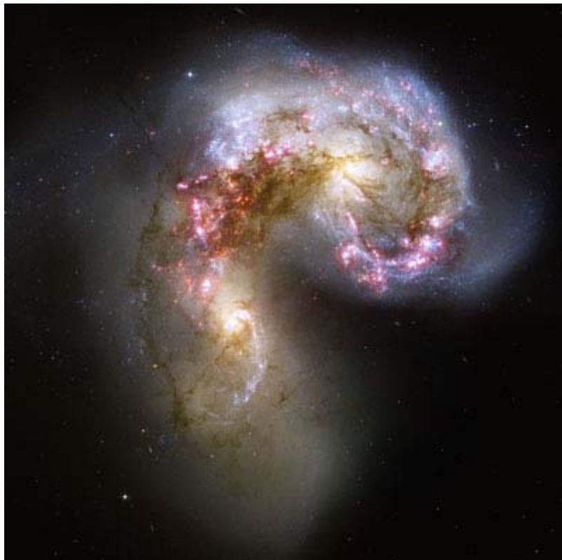
Verschmelzende „Antennae“ - Galaxien

paar Milliarden (!) Jahren unsere Milchstraßen-Galaxie mit der Andromeda-Galaxie zusammenstoßen und verschmelzen wird. Beide Galaxien bewegen sich mit hoher Geschwindigkeit aufeinander zu. Dies Ereignis wird zur Vernichtung der meisten Sonnensysteme innerhalb der Milchstraße führen, aber ebenso zum Entstehen neuer Sterne und möglicherweise auch neuer Planeten.